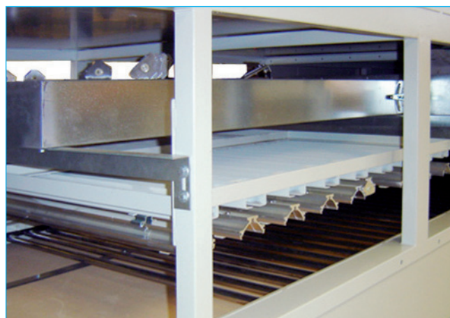
Lampade infrarosse - Infrared lamps