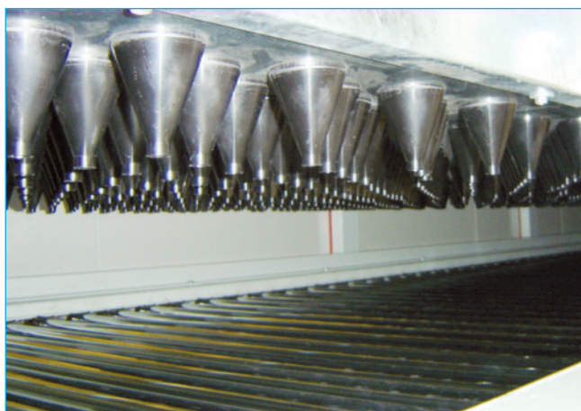
Ugelli distribuzione aria - Nozzles