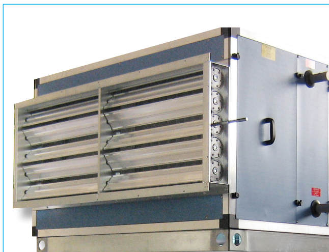
Centrale trattamento aria con batteria di riscaldamento - Air make up unit